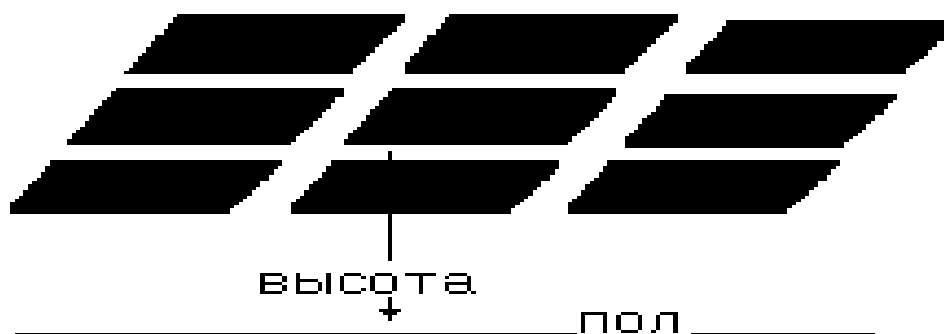
Рисунок 2 :