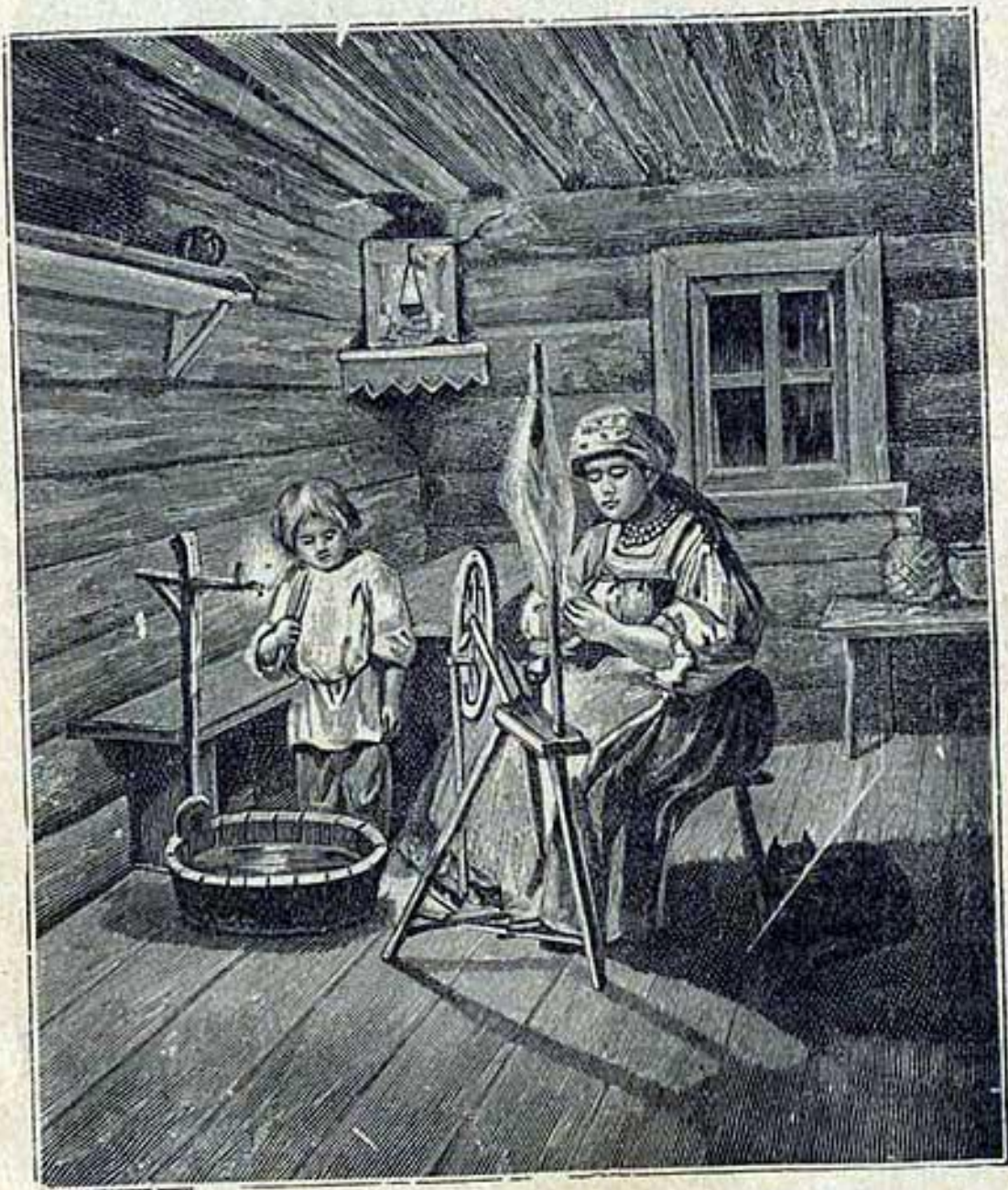
Изба при лучинѣ.

волю поджигателя своимъ быстрымъ прибы- тиемъ къ мѣсту пожара.